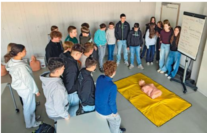
Regelmäßiges Training gibt Sicherheit bei der Reanimation – wie hier in der Konrad-Adenauer-Schule.

INFO Die Malteser haben in Kooperation mit der VR Bank, dem Landkreis Fulda und dem Schulamt ein Pilotprojekt ins Leben gerufen: Schulsanitäter und Schulsanitäterinnen werden zu Multiplikatoren weitergebildet. Diese schulen dann in den siebten Klassen ihrer Schule die Reanimation (zwei Unterrichtseinheiten).