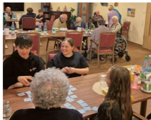
Fotos: Katrin Straßer (l.), Malteser Jugend (u.) | Text: Katrin Straßer

Bei Gesellschaftsspielen im Gemeinschaftsraum (s. Foto) wurde viel gelacht und erzählt. „Besonders schön war der Moment, als uns eine sehr rüstige Bewohnerin ein neues Kartenspiel beibrachte, das wir anschließend gemeinsam ausprobierten. Dieses Spiel möchten wir künftig auch in unseren Multi-Gruppenstunden aufgreifen.“ Der Nachmittag voller herzlicher und wertvoller Begegnungen wird nicht der letzte sein: Weitere gemeinsame Termine sind bereits vereinbart.