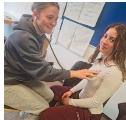
Fotos: Kai Lobensteiner (o.), Jutta Baumhof (u.) | Texte: Sarah Nerb

Schülerinnen erlebten einen abwechslungsreichen Pflegekurs.