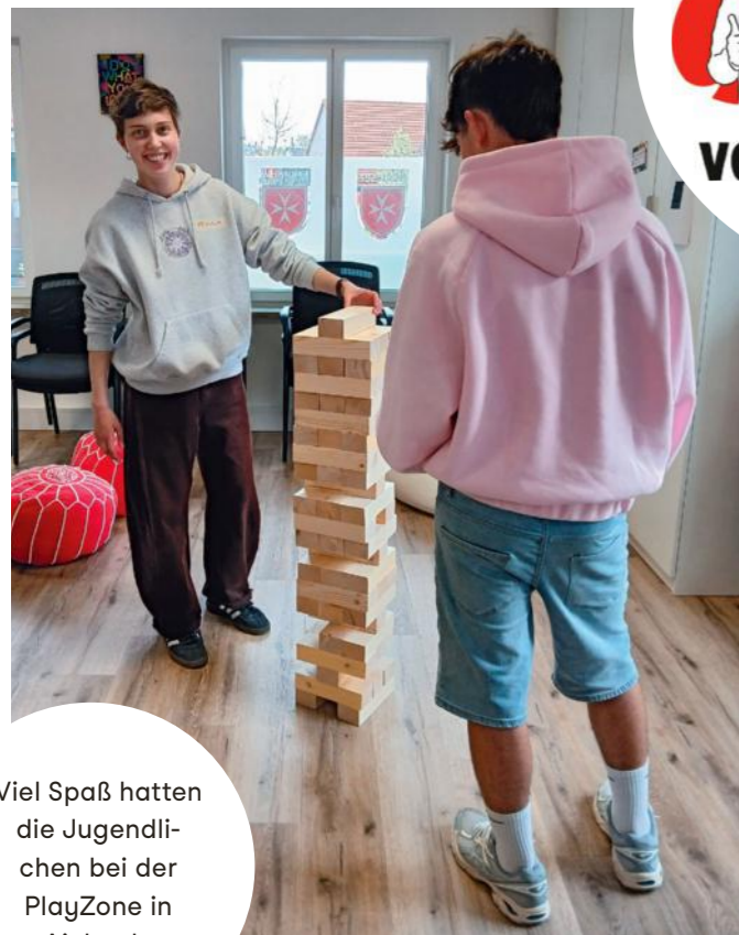
Viel Spaß hatten die Jugendlichen bei der PlayZone in Aichach.