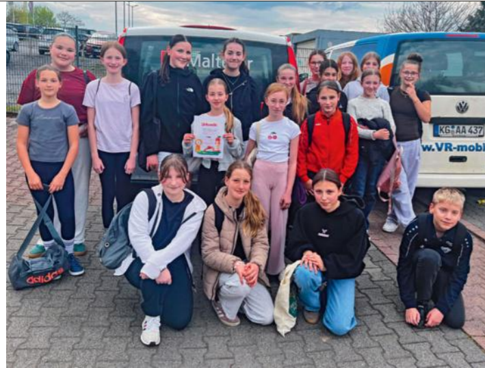
Große Freude über den Erfolg beim „Großen Stricken“