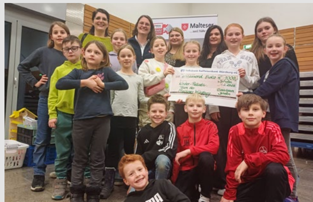
Team des Kinderkleidermarkts in Iphofen

Unser Spendenkonto: IBAN DE27 3706 0120 1201 2220 16