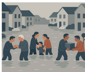
Naturkatastrophen & Extremwetterlagen