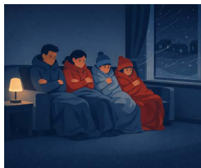
Strom- & Netzausfall

Krisen sind Teil unserer Realität. Wer vorbereitet ist, kann ruhig bleiben, Prioritäten setzen und andere unterstützen.