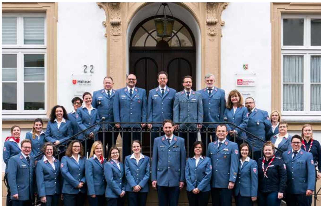
Die Mitarbeiterinnen und Mitarbeiter der Diözesan- und Bezirksgeschäftsstelle.