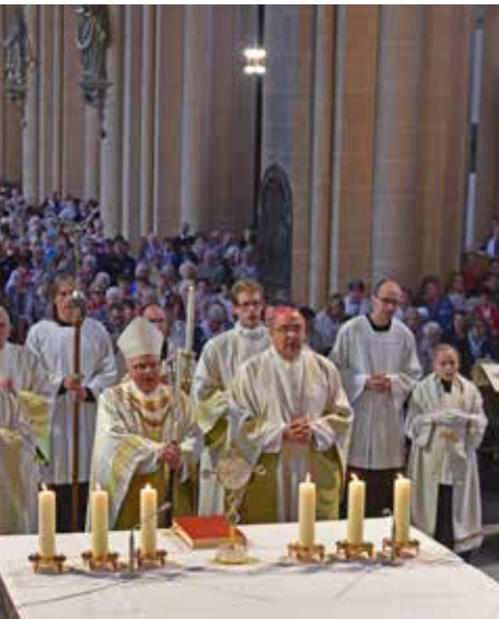
1 Pontifikalamt mit Weihbischof Hubert Berenbrinker im vollbesetzten Dom.