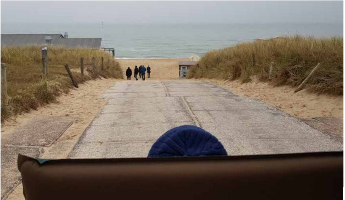
Klaus Schmidts Herzenswunsch wurde erfüllt: Noch einmal konnte er das Meer sehen.