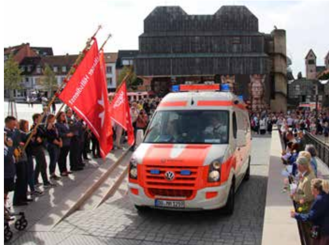
3 Eine große Prozession zieht vom Schützenhof quer durch Paderborn bis zum Dom.