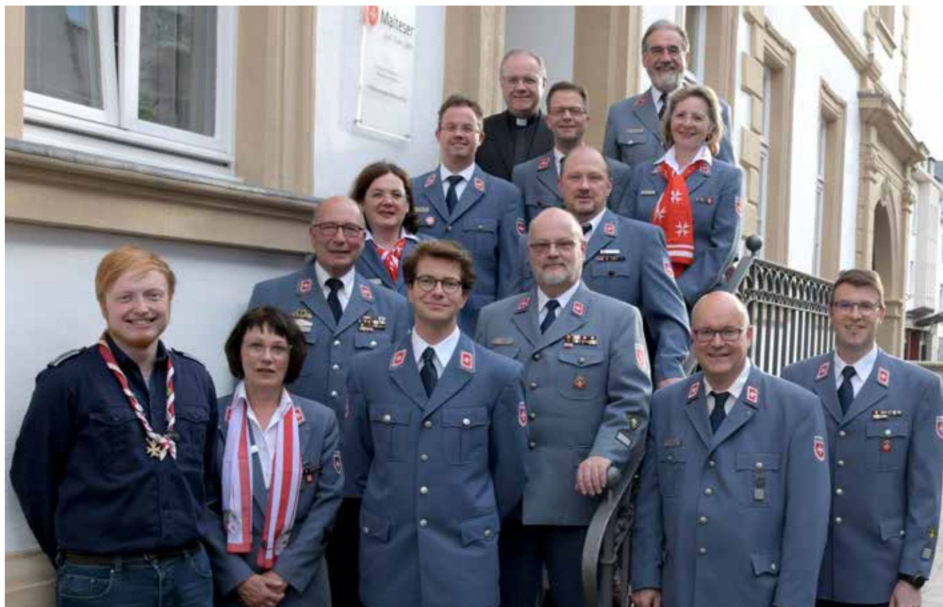
Der Diözesanvorstand der Malteser in der Erzdiözese Paderborn.