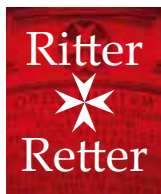
Herne Roonstr. 86 44628 Herne Tel. (0 23 23) 147 84 44 N.N.