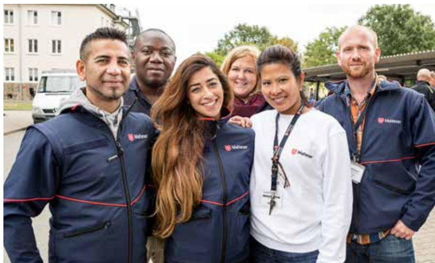
Geflüchtete haben viele Fragen zu unterschiedlichen Lebensbereichen. Die Fortbildungsinitiative „Integrato“ will den Betreuern helfen, Antworten zu geben.