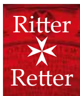
Lage Schillerstr. 11 32791 Lage Tel. (0 52 32) 69 11 67 N.N.