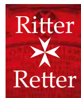
Minden St. Ansgar Str. 8 32425 Minden Tel. (0 571) 620 33 N.N.